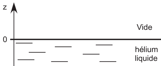
Figure 1: Géométrie du dispositif.

On considère un électron de masse m et de charge q , en mouvement à la surface d'un bain d'hélium liquide (figure 1). On suppose que le mouvement de l'électron dans le plan Oxy de la surface est limité par des électrodes non représentées sur la figure. On ne s'intéresse dans ce problème qu'au mouvement dans la direction z perpendiculaire à la surface.